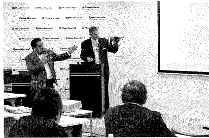
世界各国のエキスパートが講師を務めた